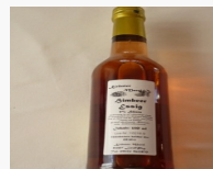
Himbeer Essig / 350 ml 4.10EUR